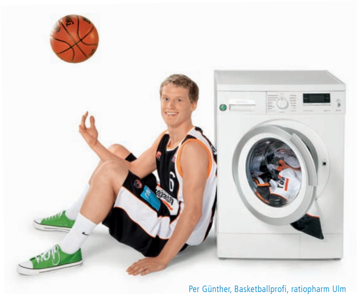
Per Günther, Basketballprofi, ratiopharm Ulm

besteht zu 100 % aus umweltfreundlicher Wasserkraft. Ein großer Teil wird vom Donau-Wasserkraftwerk Böfingener Halde produziert, das jährlich bis zu 50 Mio. kWh Energie in das öffentliche Netz einspeist. Durch Wasserkraft aus der Schweiz kommen weitere 60 bis 70 Mio. kWh hinzu. In Zukunft ergänzt die SWU NaturStrom-Erzeugung auch ein Biomassekraftwerk sowie Windkraftanlagen an der Nord- und Ostsee.